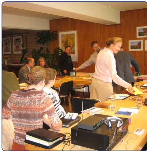
ein CDK Seminar ...

Bitte fordern Sie unseren Rundbrief an, wenn Sie weitere Informationen haben möchten und auch zu anderen Seminaren eingeladen werden wollen.